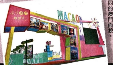
■澳門旅遊局於今屆香港國際旅遊展的參展攤位將採用立方體設計，展現不同的澳門面貌。

講座時間：6月17日（周六）3:00pm-3:30pm 6月18日（周日）1:00pm-1:30pm 網址： https://www.facebook.com/ExperienceMacao/