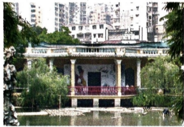
■來到盧廉若公園，勿錯過正在園中春草堂舉行的「頤園書畫會會員作品展」。

日期：即日起至6月25日 時間：9:00am-7:00pm，駐場導賞逢周六及周日3:00pm-4:00pm 地點：盧廉若公園春草堂 查詢：(853) 8988 4000