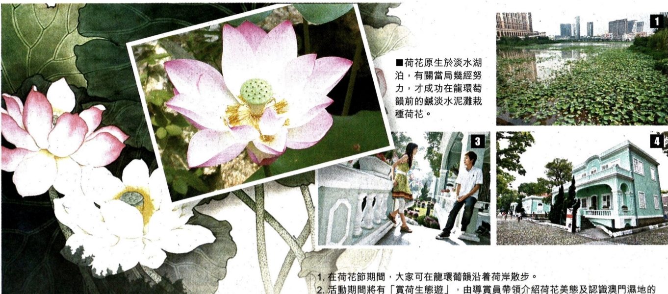
■荷花原生於淡水湖泊，有關當局幾經努力，才成功在龍環葡韻前的鹹淡水泥灘栽種荷花。