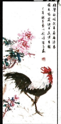
■展出的作品題材多樣，除畫外還有書法及篆刻作品。