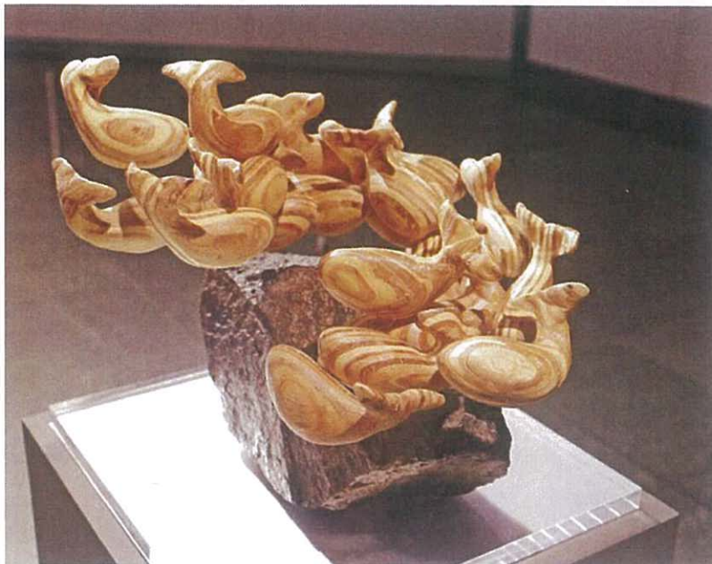
作品《魚2》中前後景分明，並用魚與魚之間的空间營造出魚群的游動方向。

📍 氹仔舊城區藝術空間 (逢周一休館) 🕒 即日起至9月6日(12:00-20:00) 🎟 免費