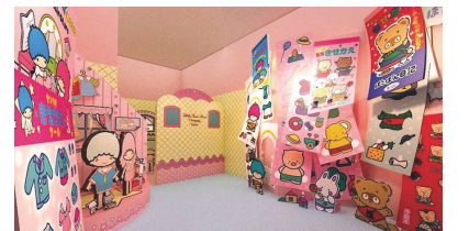
粉色的夢幻小鎮聚齊 Sanrio 家族