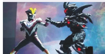
奧特曼·英雄再現舞台劇精彩絕倫