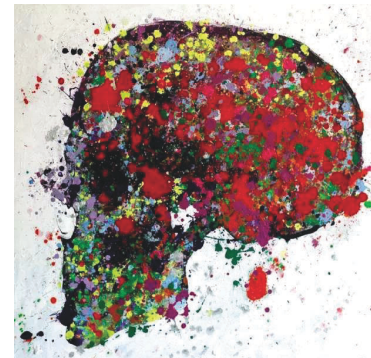
《Human》以骷髏頭作為靈感來源