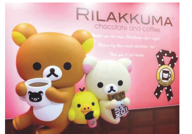
可愛的輕鬆小熊受到全民追捧