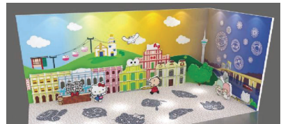
活潑可愛的 Sanrio 家族齊齊探訪澳門熱門景點