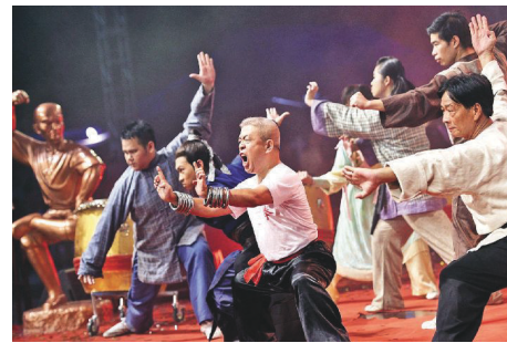
2017 武林群英會吸引眾多高手一試高下

地點：塔石體育館、澳門綜藝館、奧林匹克體育中心運動場室內體育館、塔石廣場、友誼廣場