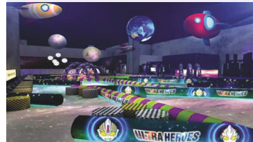
奧特曼室內遊樂場驚險刺激

“奧特曼·英雄再現澳門站 2017”通過全亞洲最大型室內遊樂場及真人舞台劇與粉絲見面，展開銀河系最強守護者奧特曼(咸旦超人)英雄們的正義之旅。