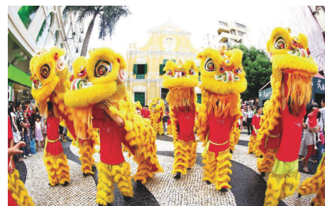
“武術龍獅巡遊”與觀眾熱情互動