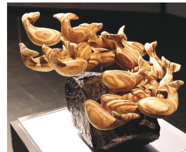
栩栩如生的《魚群》啟發空間的思考