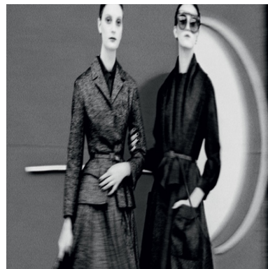
抽象之旅，迪奥2017秋冬高定系列大片