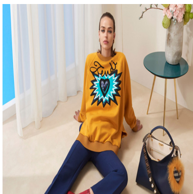
打开你的心扉，FENDI 2018早秋系列