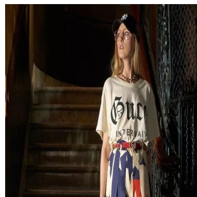
再现罗马惊悚电影， GUCCI 2018早秋系列