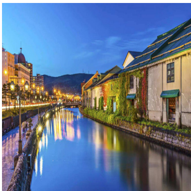
这个冬天最温暖的情书， 写于北海道