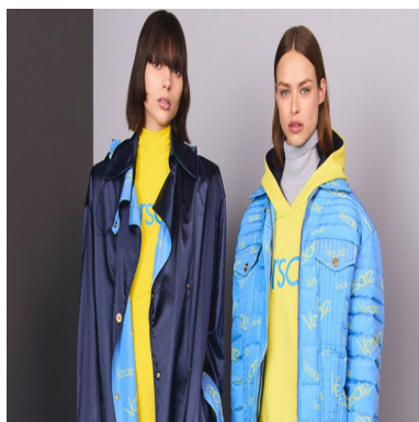
飘逸灵动，Versace 2018早秋系列