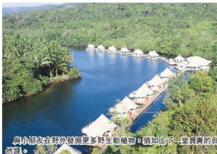
與小朋友在野外發掘更多野生動物植物，猶如上了一堂寶貴的自然課。

想跟野生動物近距離接觸，並不一定要去非洲那麼遠，酒店旅遊集團 Secret Retreats 新推出東埔寨探索野生動物之旅。賓客只要入住沿著 Tatai 河而建的四河浮動旅館，便可參與專人導賞團，深入探索這人迹罕至，並擁有全東南亞最多種類動植物的熱帶天堂，當中包括瀕臨絕種的印度支那虎、馬來潮龜、暹羅鱷等，還有很多野生動物植物有待發掘，最適合帶同小朋友作野外體驗。