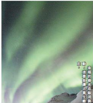
動盪的極光在銀河系星圖作背景下，展現如絲帶在黑夜中飛舞。