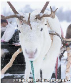
因天氣極度寒冷，挪威當地人多吃鹿肉補身。