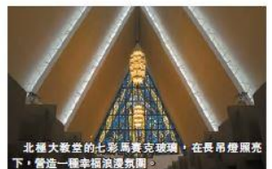
北極大教堂的七彩馬賽克玻璃，在長吊燈照光下，營造一種幸福浪漫氛圍。