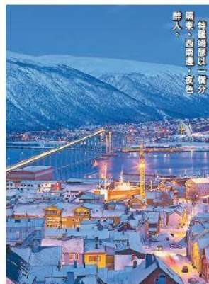
特羅姆瑟以「極光之城」聞名，西兩地，夜色。

最後一站，筆者來到地標——北極大教堂（Arctic Cathedral），教堂的水晶長吊燈，點亮了五光十色的馬賽克玻璃，站在門外觀看，整個人好像被滿滿的幸福感紅潤了全身，暖上心頭。當我欲按下快門留下倩影時，竟發現極光原來正悄悄地在天空躍動。眼前這景色，猶如置身於人間的夢幻仙境，令人陶醉其中，久久不願離去。