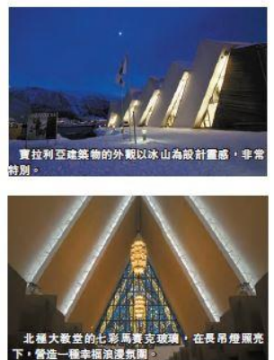
寶拉利亞建築物的外觀以冰山為設計靈感，非常特別。