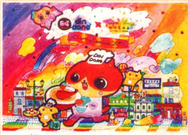
创意艺术展览选图

此外,3月22日在澳门文化中心地下开幕的《变大高低加》展览,展出葡萄牙籍画家马荣达的作品,他从2009年迁居澳门后,用视觉文字游戏来创作自己的图像作品,也是一种观赏澳门的视角。