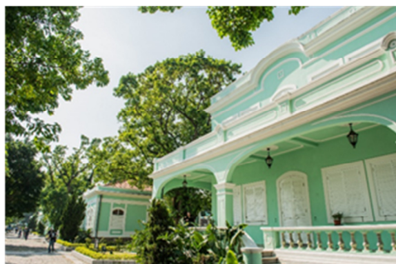
龍環葡韻住宅式博物館