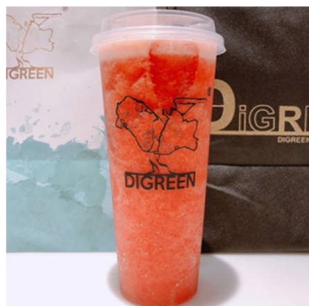
Digreen 夏日消暑特饮(草莓味)