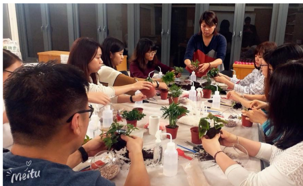
夏日微景观生态瓶工作坊